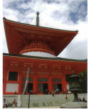
「高野山壇上伽藍根本大塔」